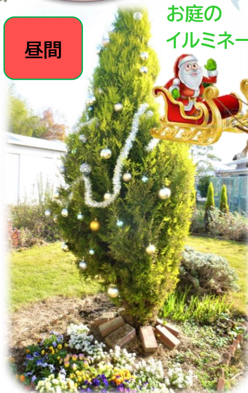
お庭の イルミネーション