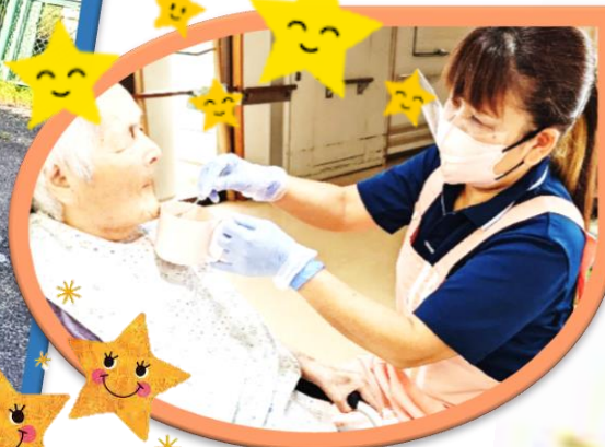
感染症対策を徹底して ケアしています。