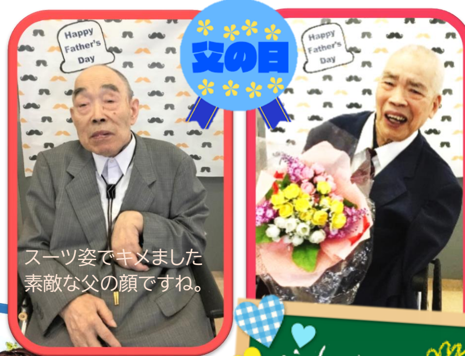
スーツ姿でキメました 素敵な父の顔ですね。

先月に引き続き、通所情報雑誌 「月刊デイ8月号」にご利用者様2名の 俳句が掲載されました。 これからも俳句作りにチャレンジしまあ～す。