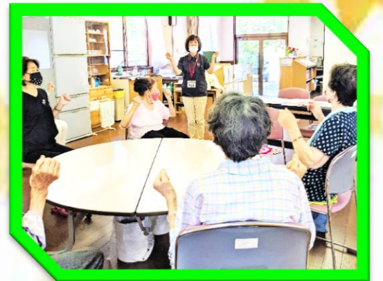
地域サロン活動に参加しています!