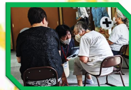
在宅介護支援センター