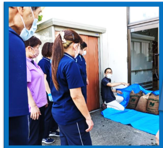
今回は水害編。地震編・火災編等 様々なパターンの訓練を実施中!