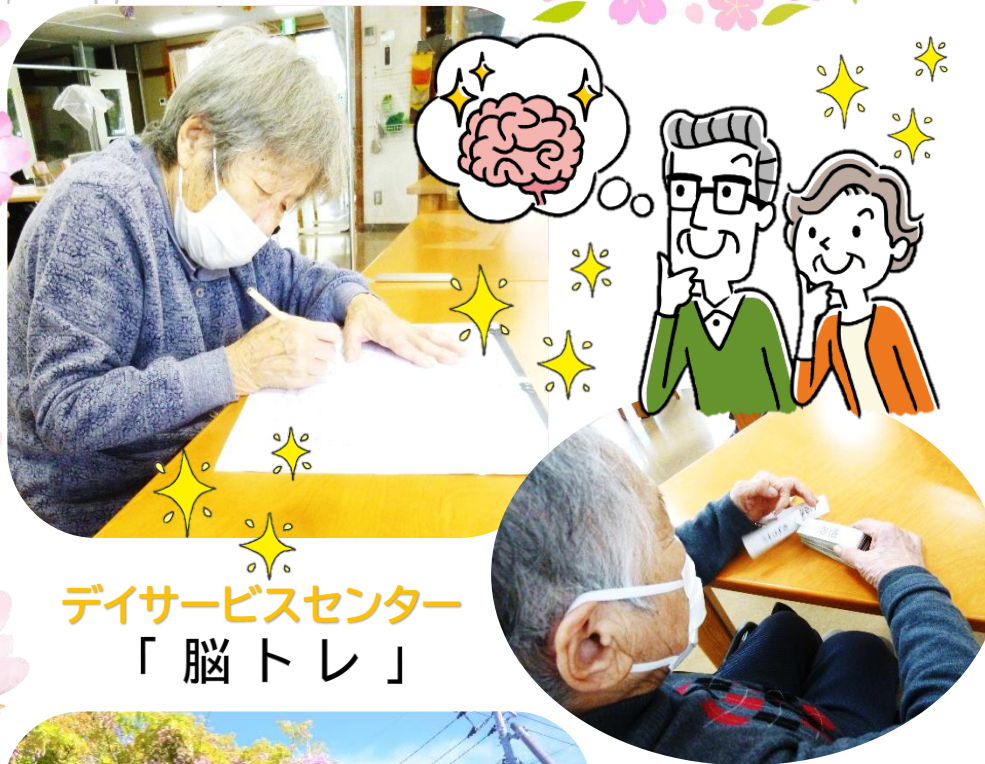
デイサービスセンター 「脳トレ」