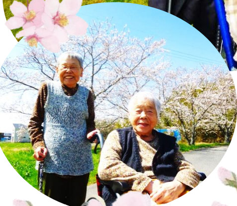
小春日和にお散歩 敷地内の満開の桜と 記念撮影です！