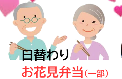
日替わり お花見弁当(一部)