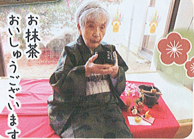
お抹茶 おしゅんぎんます