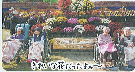
きれいな花だったよ〜