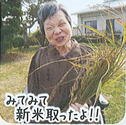
みみみみ 新米取ったよ!!