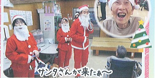
サンタさんが来たよ〜