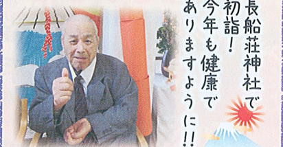
長船荘神社で 初詣! 今年も健康で ありますように!!