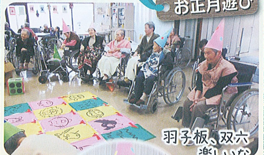
羽子板、双六 楽しいな