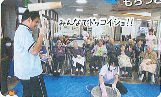
みんなでドッコイショ!!