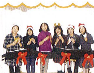
オカリナピーチ様