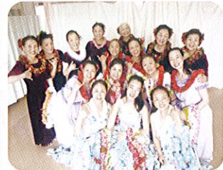
フラ・ハーロー・カ・ブ・ア・ケ・ア・オ・カ・ラ二様